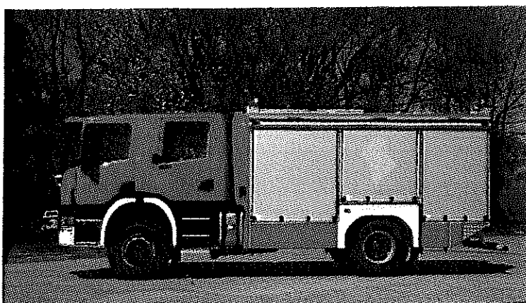
Zdjęcia nowego samochodu ratowniczo-gaśniczego OSP Dęblin-Masów.

Analizując stan przygotowania jednostki OSP Dęblin-Masów do prowadzenia interwencji gaśniczych i ratowniczych, na szczególne podkreślenie zasługuje (poza nowym samochodem) również inne wyposażenie sprzętowe i parametry operacyjne tej jednostki: