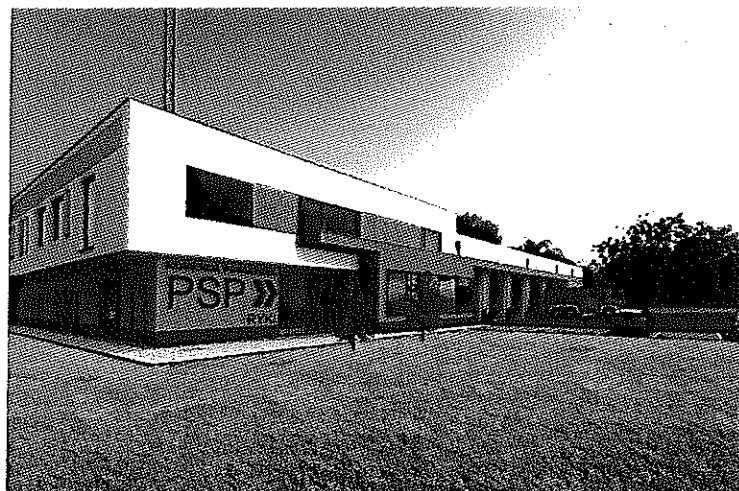
Wizualizacja planowanej do budowy strażnicy KP PSP w Rykach.