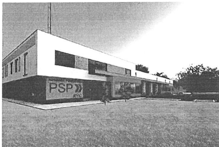
Wizualizacja nowej strażnicy KP PSP w Rykach.